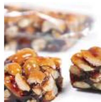
Sik à pistache (nougat cacahuète)