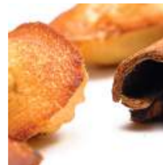
Mini madeleine cannelle de Guadeloupe

et bien plus de douceurs disponibles sur www.ilesetdelices.com