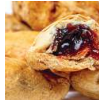
Pâté goyave (chausson goyave)