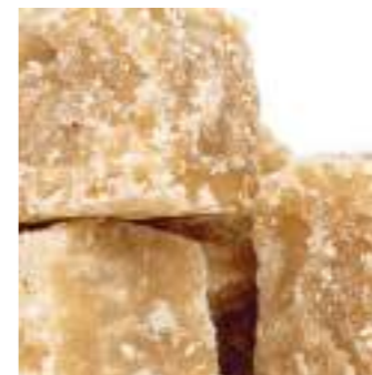
Doucelette lait de coco