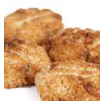
Mini macarons au coco